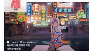
Next in Cheongsam 時裝匯演採用香港霓虹燈特效為背景