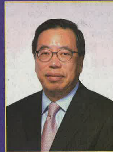
特別頒獎嘉賓 梁君彥 香港立法會主席