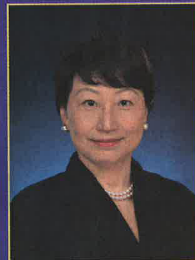
主禮嘉賓 鄭若驊 律政司司長

謹此衷心感謝各位評審鼎力支持，並恭賀《大灣區傑出女企業家獎 2018》所有得獎者，未來繼續在社會上發光發熱。