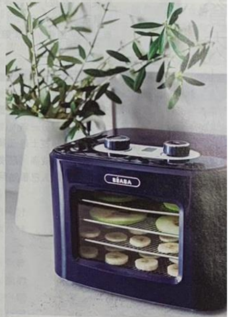
BEABA Dry n Snack 乾果機 $699

朱古力、薯片、糖果等零食多吃無益，想為孩子自家製美味健康的零食？BEABA Dry n Snack 乾果機絕對是好幫手！想鼓勵孩子多吃生果又怕經風乾的生果營養盡失？Dry n Snack 乾果機特別設計，以低溫加熱以保留營養，同時延長食物保存時間。而且簡單易用，只需把生果切片放入乾果機，調教2個旋轉按鈕：溫度設置（從35°C到80°C）和定時器設置（從1到24小時），溫度和定時器會在電子數碼屏幕上顯示，完成風乾後便會自動關機，省電方便又安全。乾果機備有3D通風系統可優化和均勻加熱，就算是較厚身多汁的生果，風乾效果一樣令人滿意。配備4層可拆卸不銹鋼多孔托盤，一次過風乾不同款式的生果，加上收集食物屑底部托盤，更適用於洗碗碟機，易於清潔。