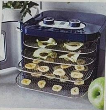
與子女一起做乾果，步驟簡單，把生果切片放入乾果機就能製作健康美味的零食，是最佳的親子活動。