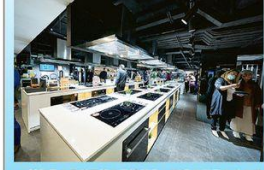
▲廚房用具是德國寶的王牌產品，旗艦店展示各式各樣的「廚房黑科技」革命性智能廚房電器及廚櫃系列。