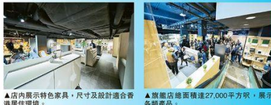
▲店內展示特色家具，尺寸及設計適合香港居住環境。 ▲旗艦店總面積達27,000平方呎，展示各類產品。

德國寶全新Lifestyle旗艦店於銅鑼灣FashionWalk隆重開幕，佔地兩層，總面積達27,000平方呎，是全港大型集電器、廚櫃、傢俬的家品體驗店。除有品牌全線王牌電器外，亦有高級訂製櫃、榻榻米積木組合、訂製梳化及摺疊牀褥等新品，應有盡有，設計型格。